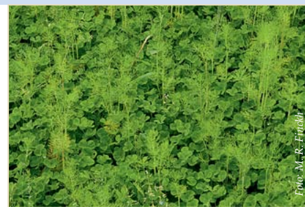
Abb. 10: Dill als Reinsaat unterdrückt alle anderen kleinsamigen Beikräuter, in Mischung mit Erdklee ist die Bodendeckung komplett.