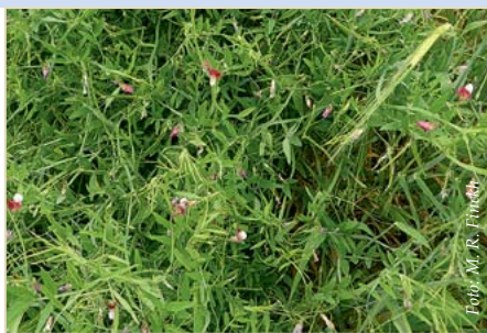
Abb. 9: Auch Platterbsen sind als Zwischenfrucht gut geeignet.