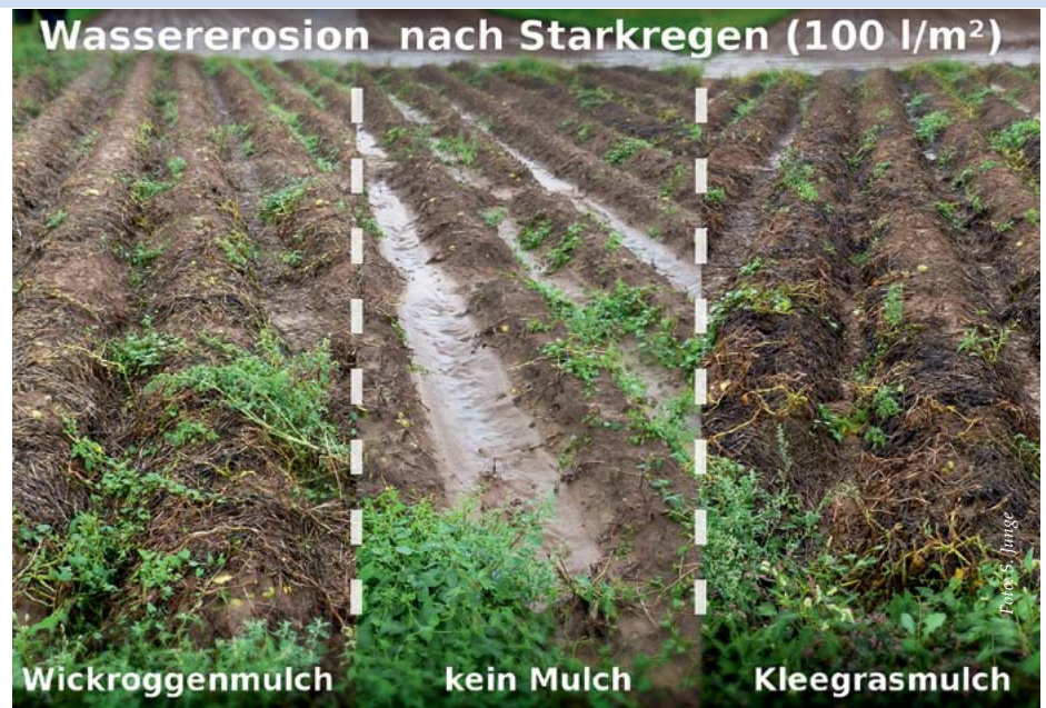
Abb. 7: Auswirkung verschiedener Mulche auf die Erosion im Vergleich zur Variante ohne Mulch, nachdem das Kraut abgeschlagen wurde (August 2015).

Der Weizen (Sorte Achat) war in allen Varianten ähnlich gesund mit insgesamt geringem Befall an Fußkrankheiten und 2014 mit moderatem Gelbrostbefall. Die Erträge lagen erwartungsgemäß in der pfluglosen Variante unter der gepflügten Variante, wobei der Unterschied im zweiten Versuchsjahr nicht ganz so groß war (Abb. 5). Eine mögliche Erklärung hierfür könnte sein, dass im zweiten Versuchsjahr erstmals der WecoDyn zum Einsatz kam. Der Weizen lief deutlich besser auf als im