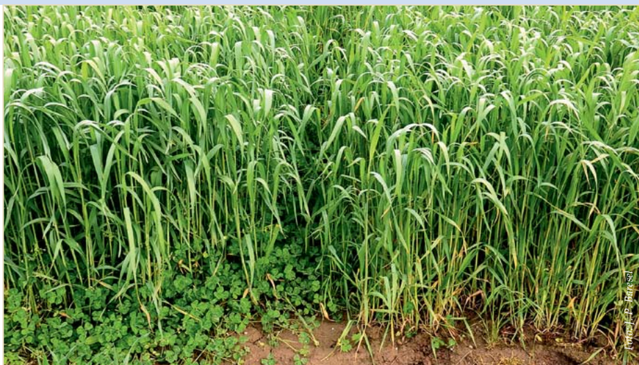
Abb. 11: Erdkleeuntersaaten in Weizen.