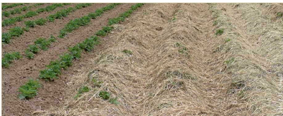
Abb. 6: Kartoffeldämme mit Mulchbedeckung: Die gemulchten Bestände profitierten besonders 2015 von der Feuchte unter dem Mulch und konnten den Entwicklungsrückstand gut kompensieren.

Im Rahmen dieses Projektes werden auf Mulch und Zwischenfrüchte basierte Minimalbodenbearbeitungssysteme optimiert und die gewonnenen Erkenntnisse der Praxis zur Verfügung gestellt. Hierzu werden 6 konventionell und 6 ökologisch bewirtschaftete Feldversuche an 11 Orten durchgeführt. Je nach Anbauregion unterscheiden sich die Hauptkulturen, außerdem werden in einzelnen Versuchen weitere