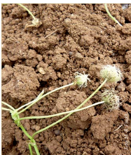
Abb. 12: Blütenstände des Erdklee. Die Samenträger oben haben sich bereits in die Erde eingegraben.

um Nährstoffe und Wasser. Deshalb sind Arten, die im Mai in die Samenreife gehen und dann erst spät im Juli oder im August wieder anfangen zu wachsen, von besonderem Interesse. Während der Weißklee im Prinzip gut geeignet wäre, sind die aktuellen Sorten auf Futterproduktion gezüchtet und damit zu konkurrenzstark, um zum Weizen zu passen. Hier müssen noch Alternativen gefunden werden.