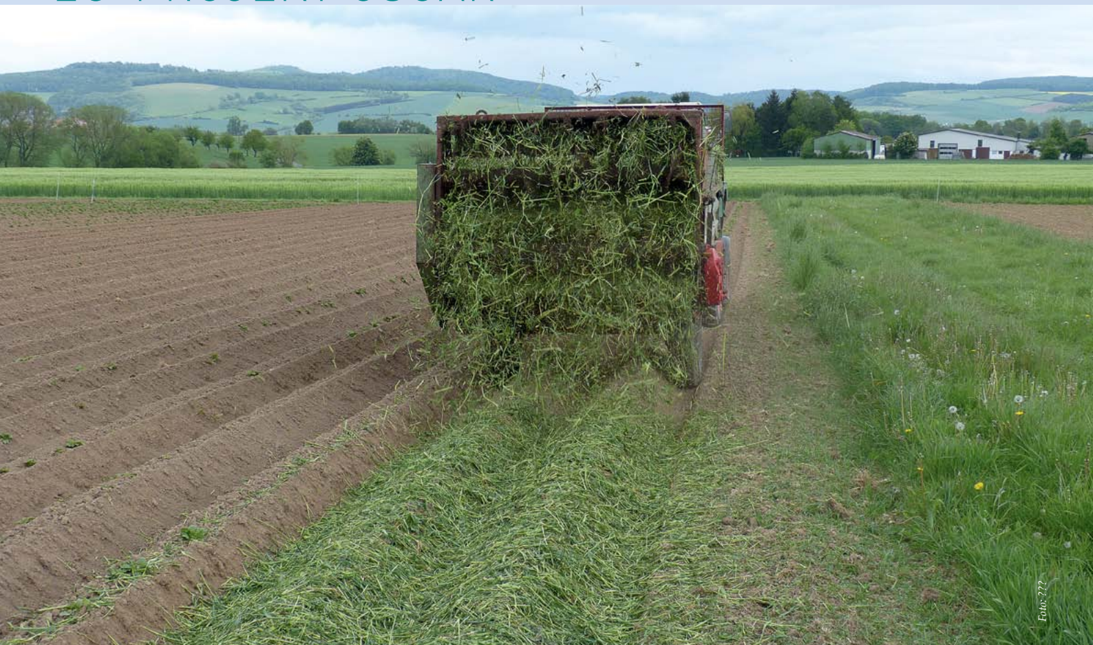
Abb. 1: Ausbringung eines Mulches, bestehend aus Wickroggen bzw. einem Erbsen-Triticale-Gemenge, mit einem Miststreuer auf die vorbereiteten Kartoffeldämme.