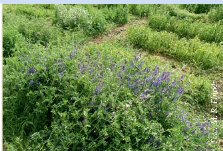
Abb. 8: Versuchspartellen mit verschiedenen Wickengenotypen.